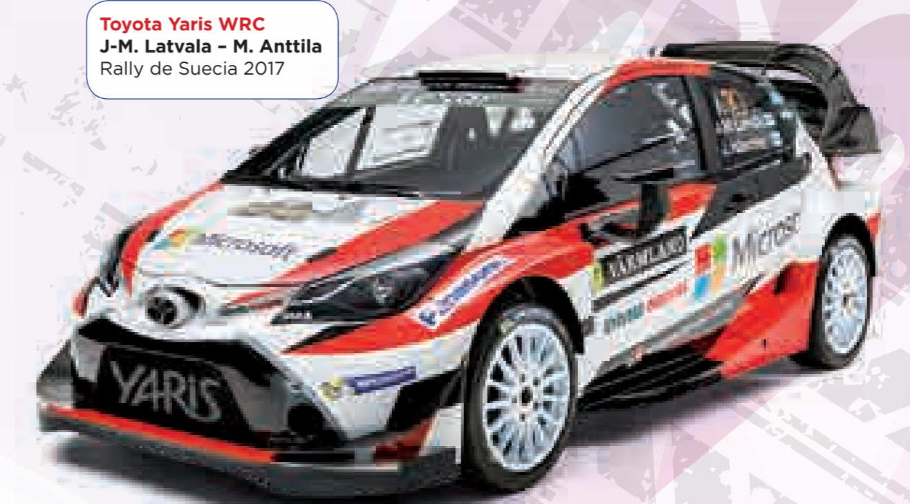
Toyota Yaris WRC J-M. Latvala - M. Anttila Rally de Suecia 2017