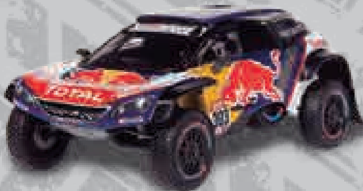
→ Peugeot 3008 DKR Carlos Sainz (Rally Dakar 2018)

*Con la oferta de suscripción recibirás por solo 1,05 € adicionales por número (a partir de la entrega 4) el Mini Countryman de Nani Roma (Rally Dakar 2014) con el envío 15, el Peugeot 2008 DKR de Stéphane Peterhansel (Rally Dakar 2016) con el envío 20, el SMG Red Bull 303 de Carlos Sainz (Rally Dakar 2014) con el envío 25 y el Peugeot 3008 DKR de Carlos Sainz (Rally Dakar 2018) con el envío 29.