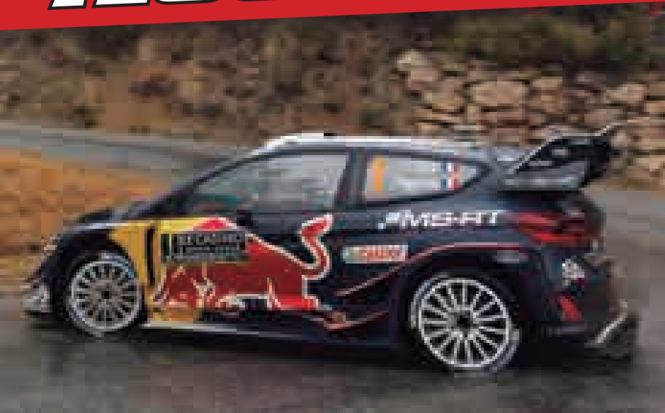
Ford Fiesta WRC S. Ogier - J. Ingrassia Rally de Montecarlo 2018