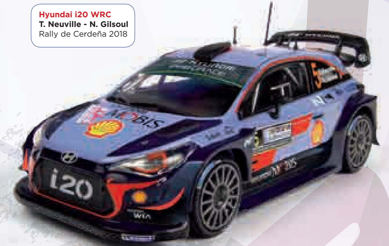
Hyundai i20 WRC T. Neuville - N. Gilsoul Rally de Cerdeña 2018