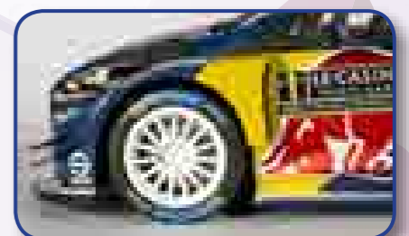
Materiales de gran calidad.