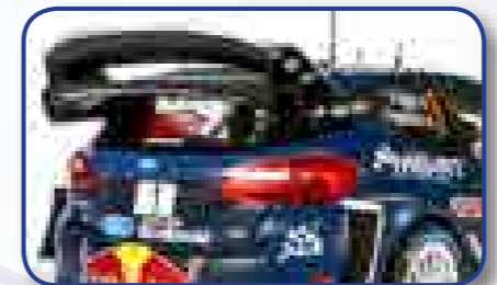
Cada detalle se reproduce con gran cuidado y precisión, y siempre respetando la escala.