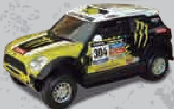
← Mini Countryman Nani Roma (Rally Dakar 2014)