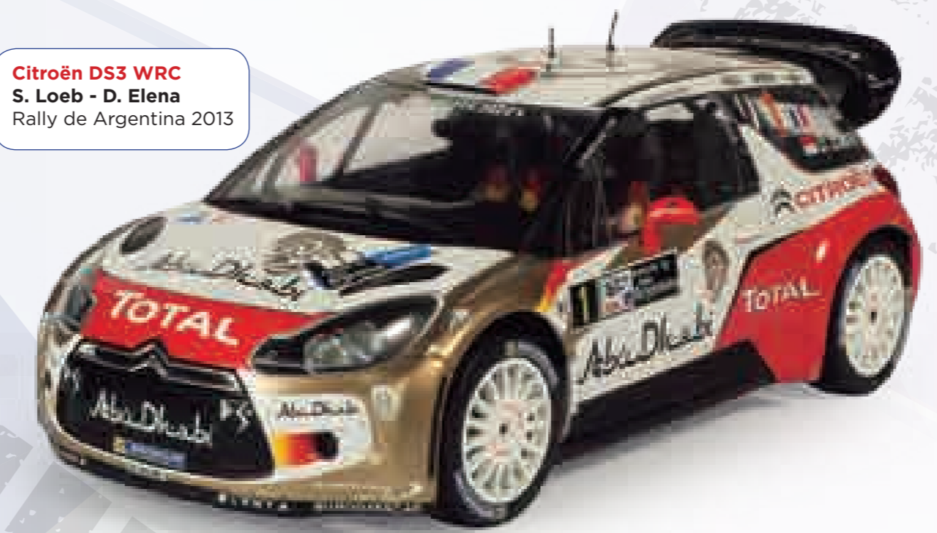
Citroën DS3 WRC S. Loeb - D. Elena Rally de Argentina 2013