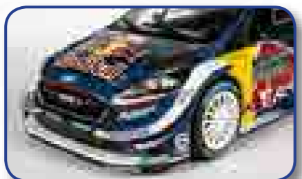
Elementos muy realistas, con un enorme grado de detalle.

provecha la oportunidad y colecciona los modelos más emblemáticos que han participado en los campeonatos de rally de los últimos años, así como los más legendarios de todos los tiempos. Estos magníficos modelos a escala 1:43, fabricados en metal y plástico inyectado, atraerán tanto a los aficionados a las miniaturas como a los entusiastas de los deportes de motor.