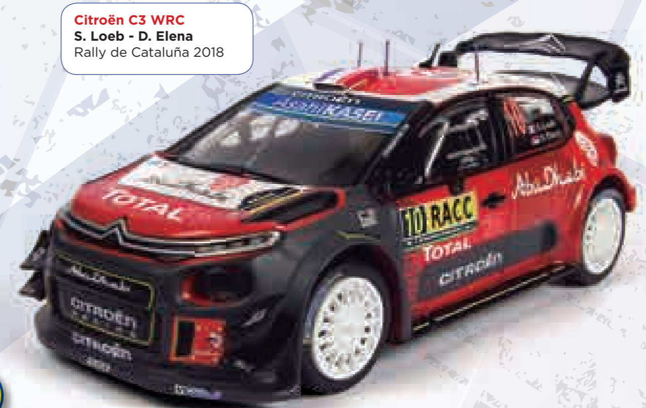
Citroën C3 WRC S. Loeb - D. Elena Rally de Cataluña 2018