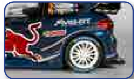
Decoraciones fieles a los modelos originales.