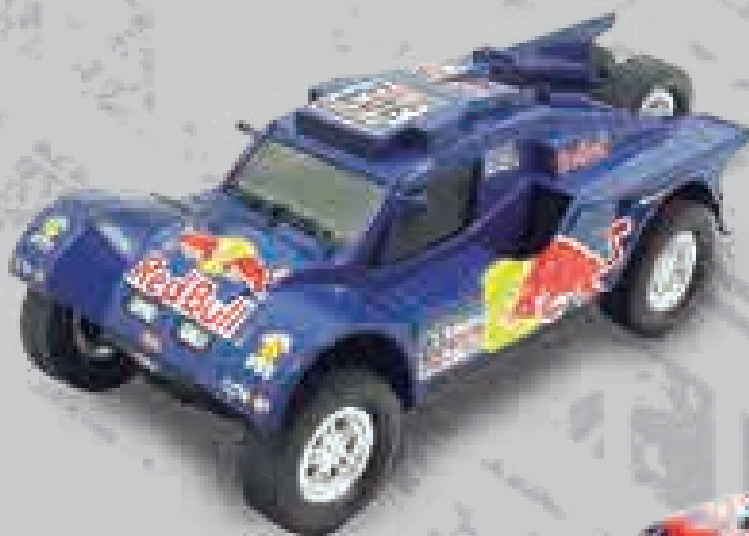
← SMG Red Bull 303 Carlos Sainz (Rally Dakar 2014)