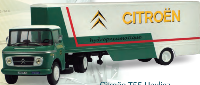
Citroën T55 Heuliez