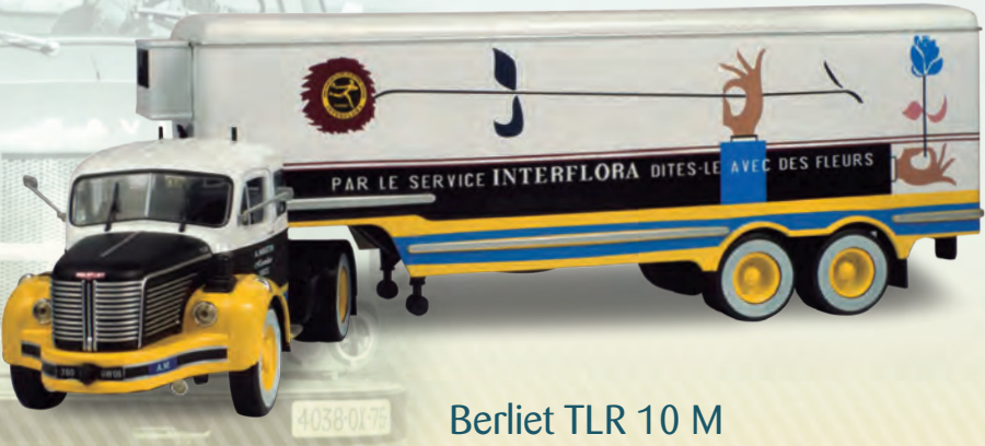
Berliet TLR 10 M