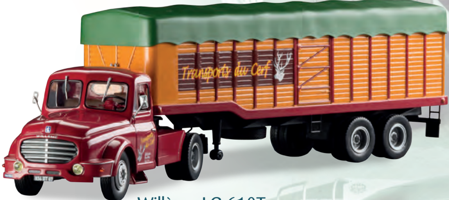
Willème LC 610T