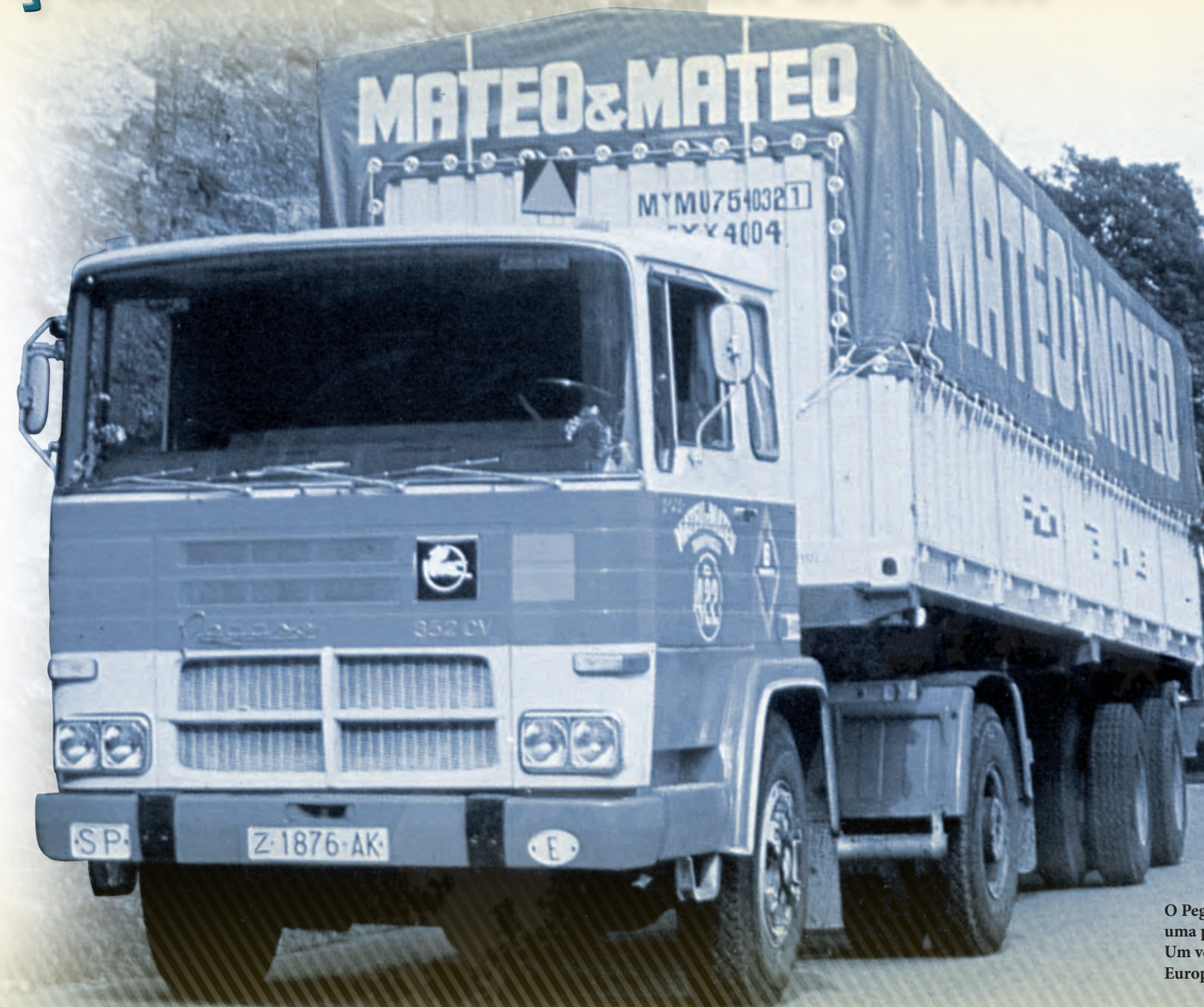
O Pegaso 2089 desenvolvia uma potência de 352 CV. Um verdadeiro recorde na Europa dos anos setenta.