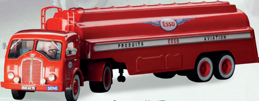
Somua JL 17