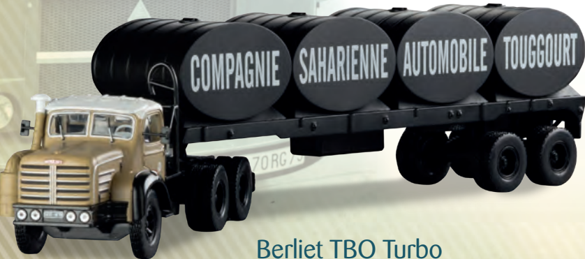
Berliet TBO Turbo