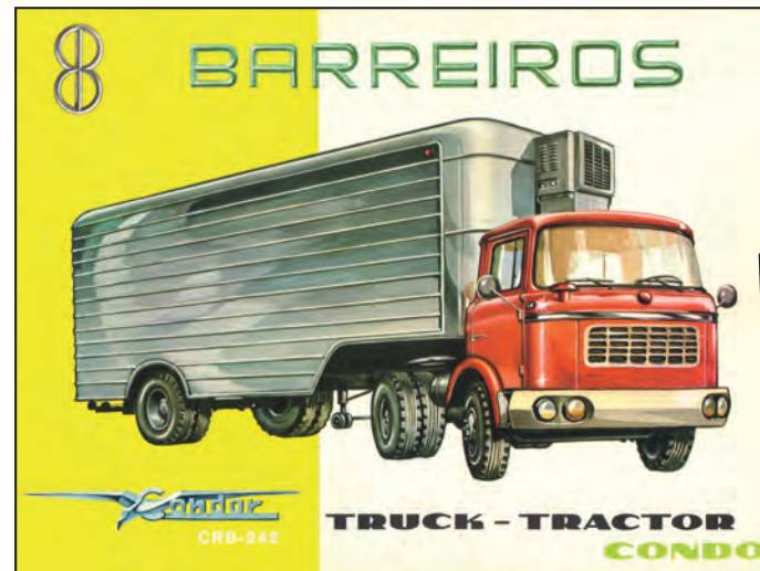
A publicidade da época salientava o grande ângulo de viragem dos tratores.

De igual modo, o aparecimento dos camiões articulados significou uma grande revolução em tudo o que se referia à distribuição e logística de mercadorias. O camião, ao deixar de estar subordinado às caixas de carga fixas, passou a ser um ente autónomo que podia transportar um ou outro tipo de mercadoria em função da oferta e da procura. Assim, por exemplo, um mesmo veículo podia sair de Aveiro pela manhã com destino ao Porto, carregado com uma cisterna de leite, e regressar pela tarde ao ponto de origem com um reboque de gado. A liberdade chegava ao mundo do transporte!